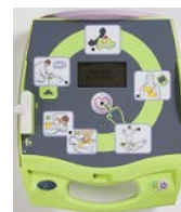
絵文字インジケータ (表示ランプ)