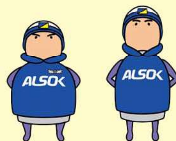
アルソック ALSOKガードマンより