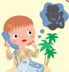
安心してお留守番編