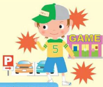
安全な街って何だろう編

子どもたちが犯罪に巻き込まれる悲しい事件があとを絶ちません。被害者にならないためには、親だけでなく、子どもにも防犯意識をしっかりと身につけさせる必要があります。防犯意識を身につけさせることは、怖がらせたり、不安に感じさせるのではなく、何が危険で、どうしたらその危険から身を守ることができるのかを自分で判断する力を養うことです。略取誘拐がどこで起きているか、場所別に見たのが、下のグラフです。あんしん教室では、被害発生の多い場所ごとに、成長に応じた授業を行っています。お子さんが、あんしん教室を受けられたならば、どう感じたか、ぜひこの本を基に話し合ってください。そして、受けていない授業の内容も成長に応じてご家族の方が教えてあげてください。この本が反復練習のためのツールとして活用されることを願っています。