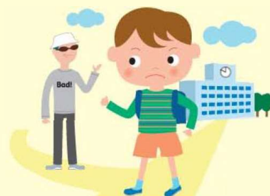
安心して登下校編